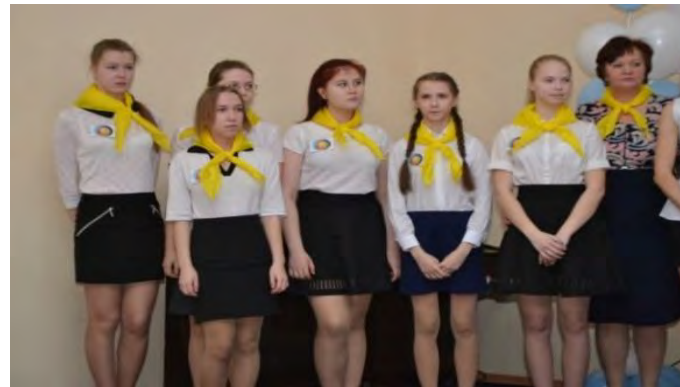
МБОУ СОШ № 18 г. Кирова