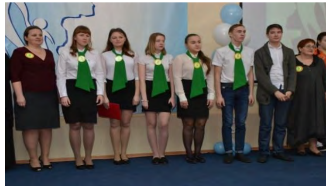
МОКУ СОШ с. Адышево, Оричевского района