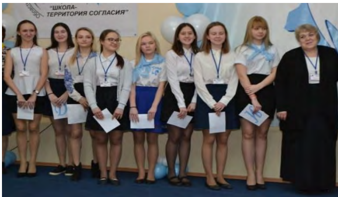
МБОУ СОШ с УИОП № 27 г. Кирова