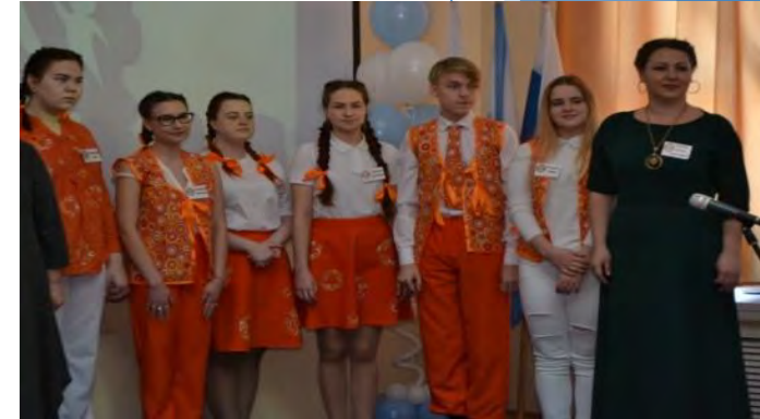
МБОУ СОШ № 56 г. Кирова